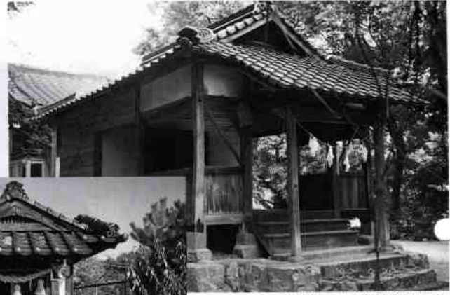
河内神社 平田2丁目24番地内