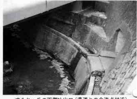
すみれヶ丘の下側吐出口(県道との合流点付近)