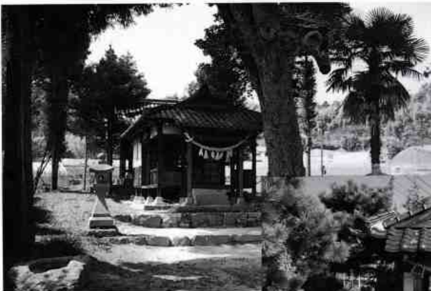
大歳神社 平田3丁目52番地内