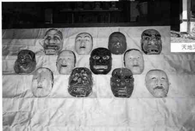
天地天神社 南岩国町2丁目80番地内